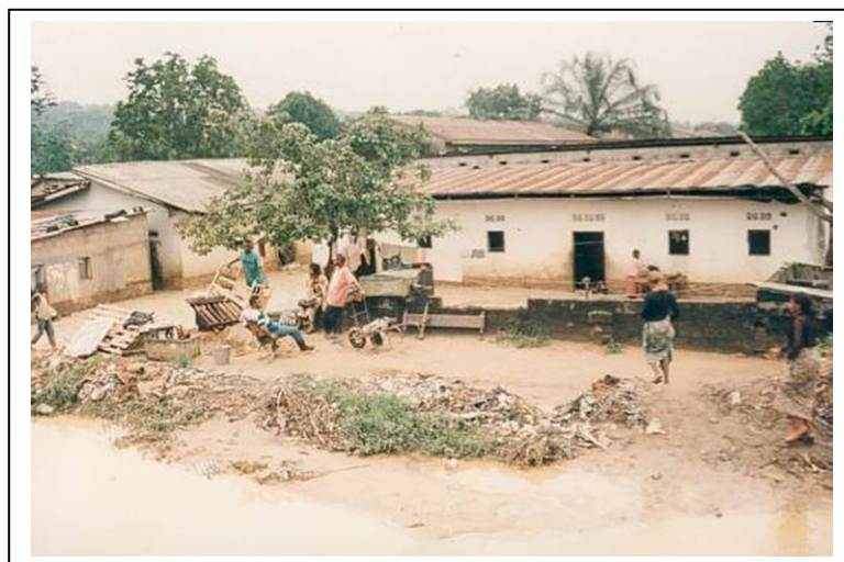
Photo : Les inondations dans les quartiers situés à l'interface Kisenso-Matete : la photo indique des biens meubles exposés à l'extérieur suite à la présence de l'eau dans les maisons.