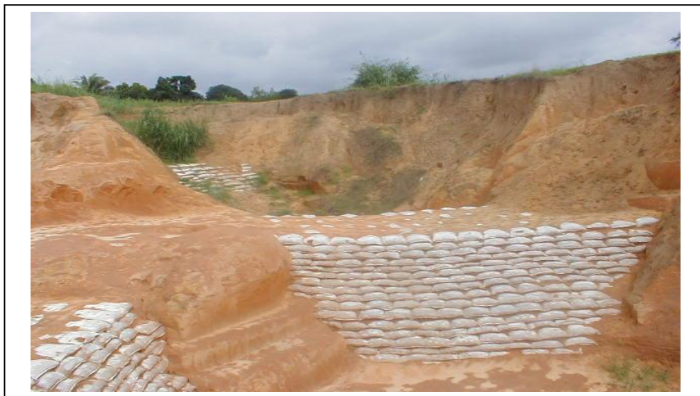
Photo: Lutte anti – érosive à l’aide des sacs de sable disposés dans une érosion à Kisenso