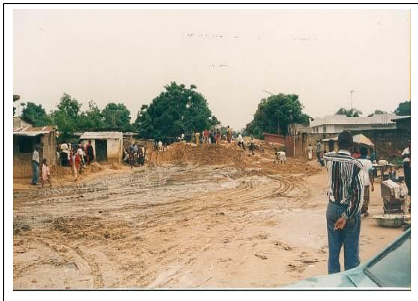
Photo 7: Des tracteurs sont entrain d'enlever le sable qui s'est accumulé dans une rue de Matete empêchant ainsi la circulation des véhicules.