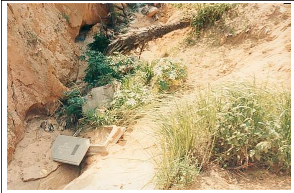
Photo: Dans le cimetière de l'Université de Kinshasa, des tombes se décrochent et s'écrasent au fond du ravin exposant des restes humains à l'air libre.