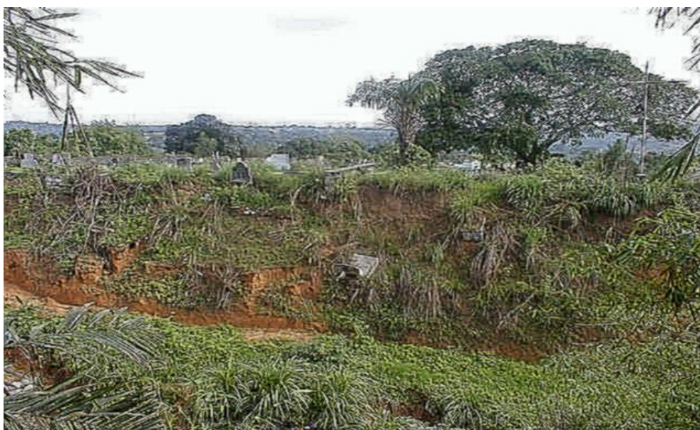
Photo 4: Maison en matériaux durables partiellement détruite par des érosions: deux chambres à coucher sont encore intactes et habitées mais le salon est complètement détruit .