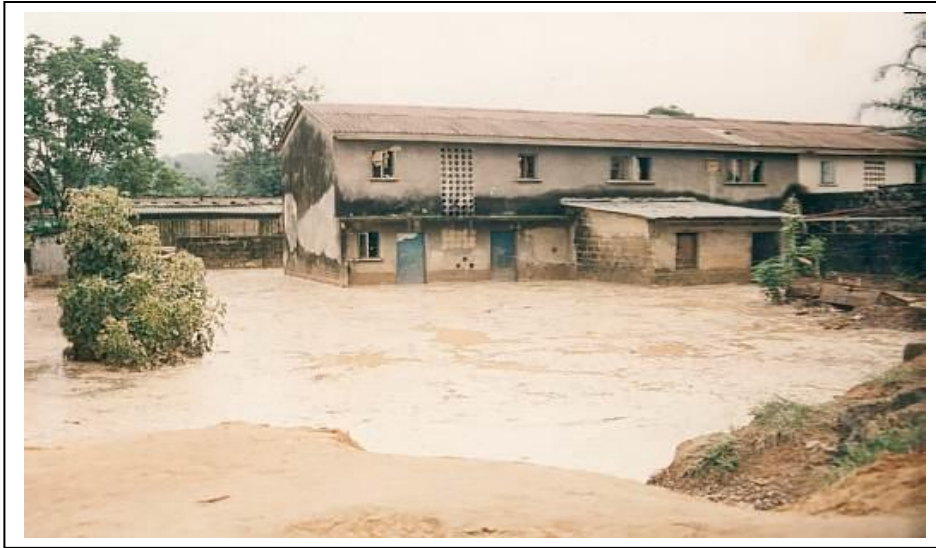
Photo: Les inondations dans les quartiers situés à l'interface Kisenso-Matete sont une des conséquences des érosions de Kisenso: ici inondations dans le quartier Kinsako (Matete).