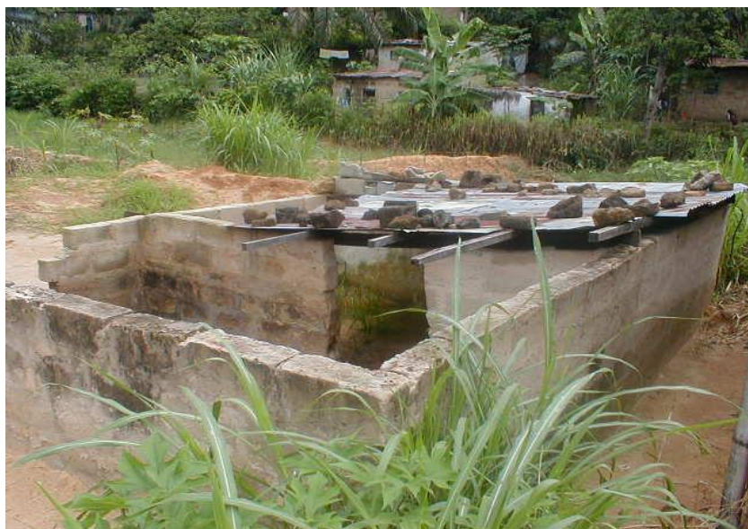
Photo: Maison complètement engloutie dans le sable provenant des érosions situées en amont

A Kinshasa, les érosions sont concentrées dans la ville haute située au sud et sud – ouest. Ces zones, réputées " non aedificandi " 2 , ont été envahies par la population qui les a occupées au mépris des normes urbanistiques. La Ville haute constitue la zone des érosions, des éboulements de terre, de glissements et d'effondrement des terrains.