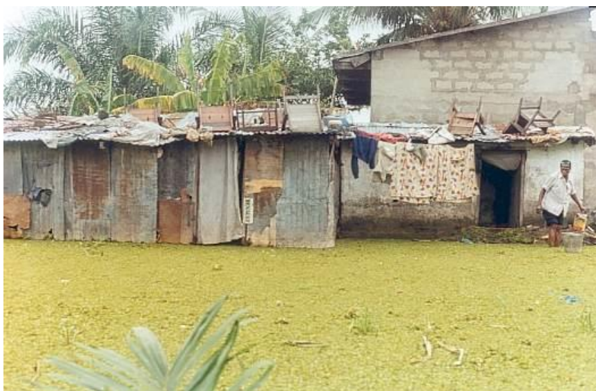
Photo : Habitation précaire construite en matériaux de réemplois dans une zone basse en proie à des inondations au niveau du pool Kingabwa.

Sources principales : Journal l'Avenir éditions n° 1142, 1212 et 1214